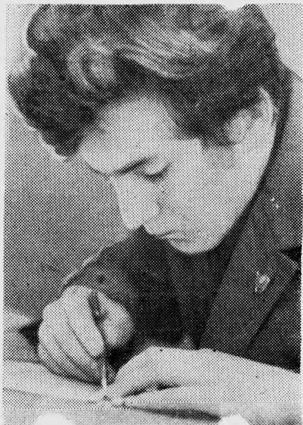
НА ЗАЧЕТЕ ПО НАЧЕРТАТЕЛЬНОЙ ГЕОМЕТРИИ.

Сессия... И некогда поднять голову от учебников, от конспектов, от чертежей. Неделю назад наш фотокорреспондент Валерий ШАТРОВ проселся с фотоаппаратом по корпусу «Г». В одних аудиториях еще читались лекции, в других — проходил прием зачетов или шла защита курсовых. Валерий принес в редакцию много снимков. И на каждом из них — студенты, склонившиеся над учебниками, над конспектами, над чертежами. Такова примета сессии.