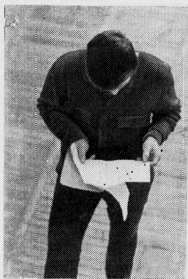
СЕЙЧАС НА ЗАЧЕТ.