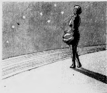
Рисунок С. ТАРАСОВА.

А мне все не будет вериться: может быть, кто пощупил, что есть Большая Медведица, что есть на свете ты?